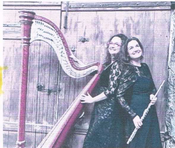
Le duo Pigaglio est attendu demain soir au Petit palais pour une balade châtoyante dans la musique classique.

américain Sol LeWitt. Ils dévoileront les secrets de réalisation de cette œuvre iconique rappelant la virtuosité des fresques de la Renaissance. Au musée Angladon, de 19 h à 22 heures, "Révélation" invite à une déambulation dans les collections, accompagnée de projections d'images sur verre de la belle-époque. Au musée Galvet, de 19 h à 20 h, un parcours de visite, "Paroles de portraits", permet de découvrir le travail d'élèves de CP de l'école Bouquerie (Avignon). Les "mini portraits" réalisés par les élèves seront exposés à côté des œuvres qui les ont inspirés. Les élèves guideront les visiteurs au cours d'une visite découverte de 19 h à 20 h. Tous ces musées sont en entrée gratuite sauf Angladon (3€) et le Grenier à sel (5 €).