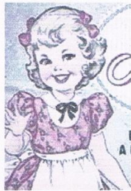
Une exposition à voir à Valréas.

Le duo Malaka en concert À Valréas, le musée du Cartonnage et de l'imprimerie sera lui aussi en entrée libre de 18 h à 23 heures. L'occasion de découvrir ou (re)découvrir l'exposition "Enfants de la réclame !". Il s'agit d'une petite histoire de la publicité enfantine de la fin du XIX e siècle au début des années 2000. Une ex-