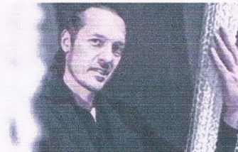
Prêts pour une balade au musée la Filature Brun de Vian-Tiran ?

APT De 18 à 21 heures, le musée de géologie de la Maison du Parc déploie animations ludiques et observations de fossiles.