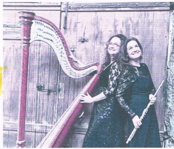
Le duo Pigaglio est attendu demain soir au Petit palais pour une balade châtoyante dans la musique classique.

américain Sol LeWitt. Ils dévoileront les secrets de réalisation de cette œuvre iconique rappelant la virtuosité des fresques de la Renaissance. Au musée Angladon, de 19 h à 22 heures, "Révélation" invite à une déambulation dans les collections, accompagnée de projections d'images sur verre de la belle-époque. Au musée Cabret, de 19 h à 20 h, un parcours de visite, "Paroles de portraits", permet de découvrir le travail d'élèves de CP de l'école Bouquerie (Avignon). Les "mini portraits" réalisés par les élèves seront exposés à côté des œuvres qui les ont inspirés. Les élèves guideront les visiteurs au cours d'une visite découverte de 19 h à 20 h. Tous ces musées sont en entrée gratuite sauf Angladon (3€) et le Grenier à sel (5 €).