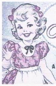
Une exposition à voir à Valréas.

Le duo Malaka en concert À Valréas, le musée du Cartonnage et de l'imprimerie sera lui aussi en entrée libre de 18 h à 23 heures. L'occasion de découvrir ou (re)découvrir l'exposition "Enfants de la réclame !". Il s'agit d'une petite histoire de la publicité enfantine de la fin du XIX e siècle au début des années 2000. Une ex-