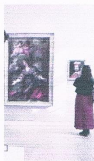
L'Inguimbertaine, un monde XXL. / J.B.R.

De 19 h à 23 h ce samedi, "La Nuit des musées" à Carpentras se concentre cette année sur la bibliothèque-musée de l'Inguimbertaine. Un seul lieu certes, mais pas n'importe lequel et unique en France. L'occasion sera belle pour celles et ceux qui découvriront l'édifice (le 2 e plus grand de Vaucluse après le Palais des Papes) de pénétrer par le grand escalier dans le sublime monument pour y découvrir sur 1000 m 2 , une enfilade de salles aménagées sur des concepts novateurs. Les objets rares, les documents précieux, les beaux arts, les tableaux valorisés peuvent suffire à l'exploration d'un œil pressé, mais il serait dommage de se priver des grandes tables interactives qui permettent de replacer les œuvres, les personnages dans leur contexte historique. On ne découvrira pas ici l'incroyable scénographie des salles consacrées au fabuleux fonds patrimonial écrit de Mgr d'Inguimbert : les 2 bibliothèques du prélat et celles du fonds Barjavel dans lesquelles le visiteur circule... et leurs prolongements, visibles au travers de vitrines. Un véritable vertige quant à la quantité rare