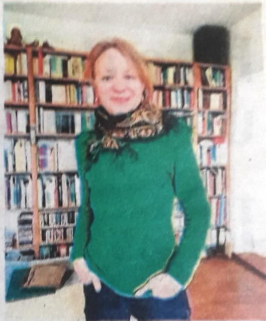
Suzanne Hetzel anime deux ateliers au musée Angladon.

Tarif : 20 € la journée. Prévoir le pique-nique. Inscriptions : a.siffredi@angladon.com