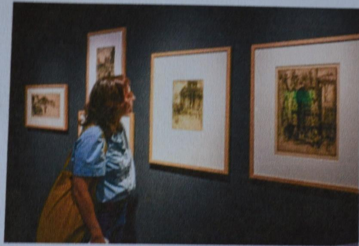
Des eaux-fortes de Hedley Fitton sont notamment exposées.

Les œuvres venues d'Asie, particulièrement du Japon, sont absolument magni-