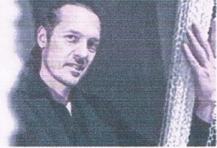
Prêts pour une balade au musée la Filature Brun de Vian-Tiran ?

APT De 18 à 21 heures, le musée de géologie de la Maison du Parc déploie animations ludiques et observations de fossiles.