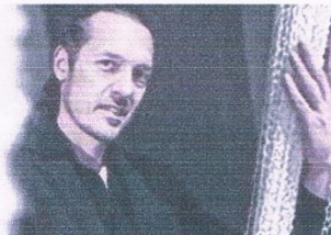
Prêts pour une balade au musée la Filature Brun de Vian-Tiran ?

APT De 18 à 21 heures, le musée de géologie de la Maison du Parc déploie animations ludiques et observations de fossiles.