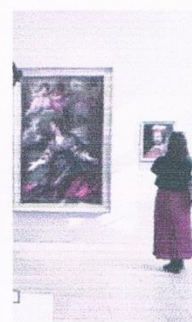
L'Inguimbertaine, un monde XXL. / J.B.

L'occasion sera belle pour celles et ceux qui découvriront l'édifice (le 2 e plus grand de Vaucluse après le Palais des Papes) de pénétrer par le grand escalier dans le sublime monument pour y découvrir sur 1000 m 2 , une enfilade de salles aménagées sur des concepts novateurs. Les objets rares, les documents précieux, les beaux arts, les tableaux valorisés peuvent suffire à l'exploration d'un œil pressé, mais il serait dommage de se priver des grandes tables interactives qui permettent de replacer les œuvres, les personnages dans leur contexte historique. On ne découvrira pas ici l'incroyable scénographie des salles consacrées au fabuleux fonds patrimonial écrit de Mgr d'Inguimbert : les 2 bibliothèques du prélat et celles du fonds Barjavel dans lesquelles le visiteur circule... et leurs prolongements, visibles au travers de vitrines. Un véritable vertige quant à la quantité rare d'ouvrages entreposés, tous dûment restaurés et répertoriés. Le public poursuivra la visite dans des espaces muséaux plus axés sur la peinture, avec notamment une superbe collection d'œuvres de peintres locaux : Laurens, Valernes, Surtel, etc. et dont certains, tel Joseph-Siffred Duplessis ont fait carrière jusqu'à la cour de France. / F.B.