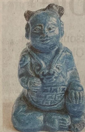
L'Enfant accroupi, statuette en céramique vernissée turquoise chinoise du XVIII e siècle, est une des curiosités du musée.