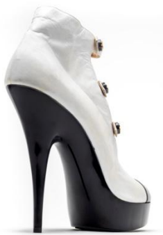
Bottine cuir et vernis. Création Chanel.