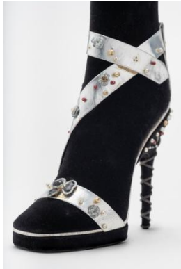
Sandale. Prototype d'un modèle rehaussé de diamants, perles fines et platine.