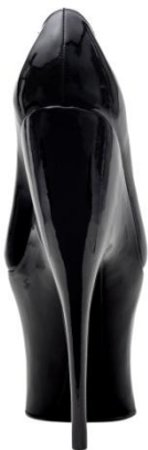
Escarpin. Cuir vernis.