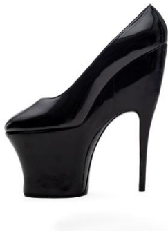
Escarpin. Cuir vernis.