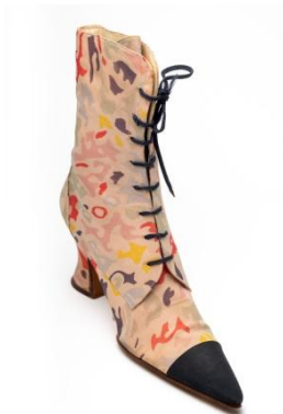
Bottillon à laçage. Création Chanel.