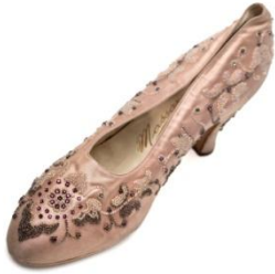
Escarpin Balenciaga pour la comtesse de Bismarck. Satin rose, perles.