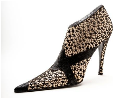
Bottine. Dentelle et satin.