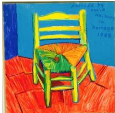
Un prêt de la Fondation Van Gogh, jusqu'au 28 octobre David Hockney La chaise et la pipe de Vincent (1988)

VISITES : la collection et ses nombreux chef-d 'œuvres (Cézanne, Degas, Sisley, Van Gogh, Modigliani, Derain, Picasso...)